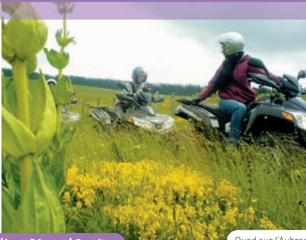
Séjour 3 jours | 2 nuits