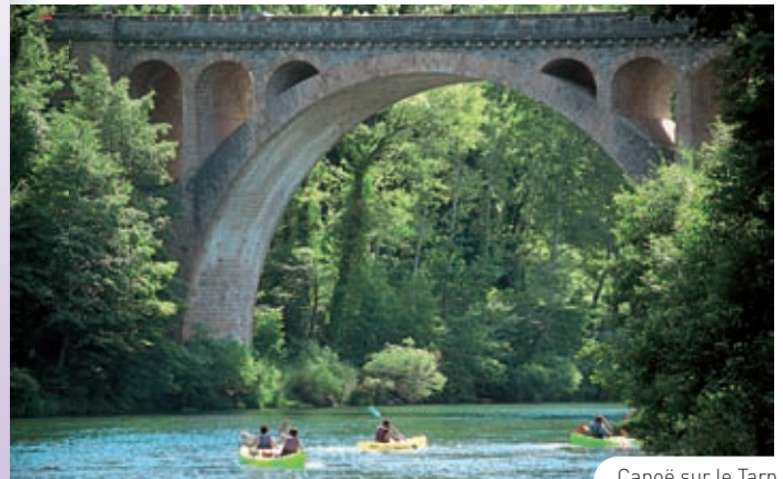
Canoë sur le Tarn

3 e Jour → Petit-déjeuner et départ des participants | Fin des prestations.